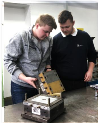
Werkzeug für Spritzguss